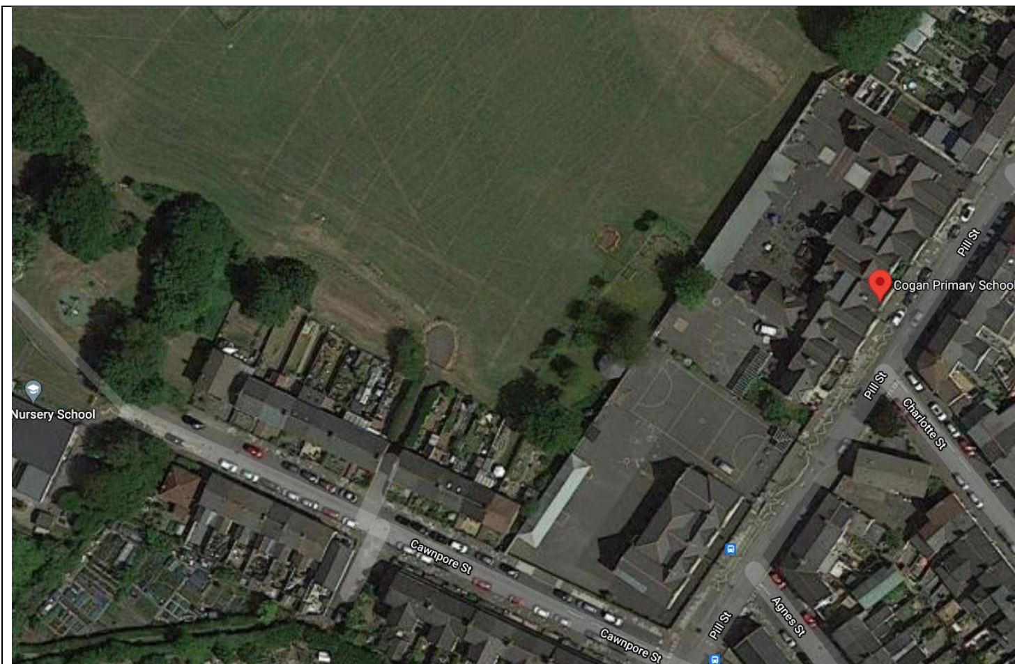
Ffigur 4 – Golwg o'r awyr ar y safle

Cafodd yr adeilad ei ddisgrifio fel “Boddhaol” yn arolwg cyflwr y Cyngor o ran ei gyflwr ac o ran ei addasrwydd. Mae ôl-groniad o waith cynnal a chadw yn costio £191,000 angen ei wneud ar adeilad yr ysgol feithrin, sef yr 17 eg isaf yn y Fro.