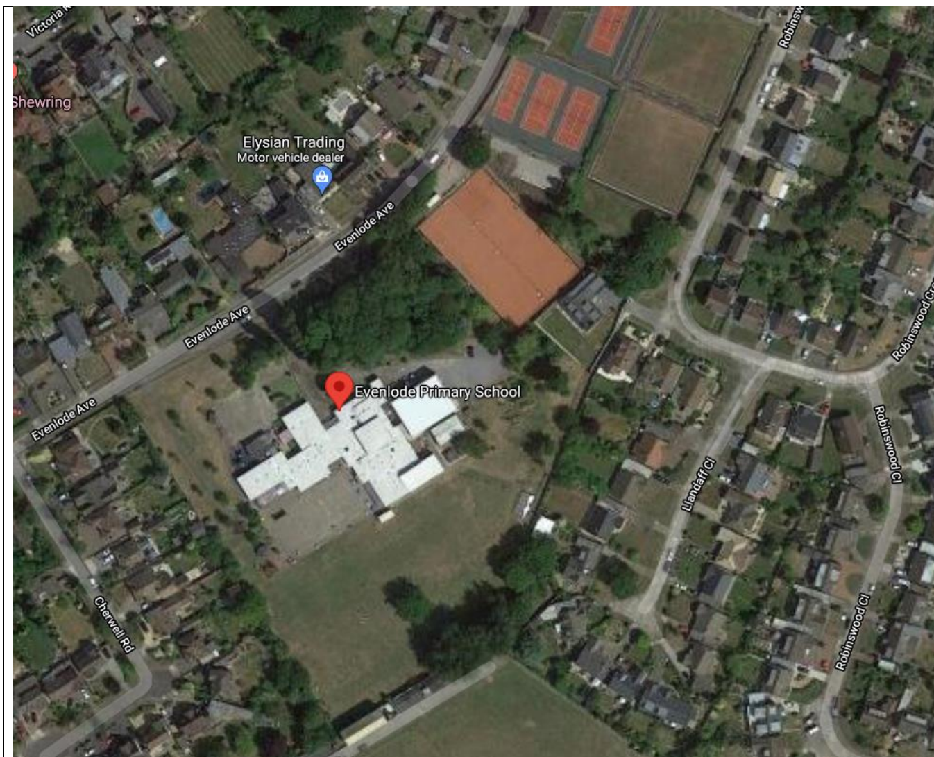
Ffigur 2 – Golwg o'r safle o'r awyr

Cafodd yr adeilad ei ddisgrifio fel “Bodddhaol” yn arolwg cyflwr y Cyngor o ran ei gyflwr a'i addasrwydd. Mae ôl-groniad o waith cynnal a chadw yn costio £529,500 angen ei wneud ar adeilad yr ysgol, sef y 14 eg uchaf yn y Fro (y 10 fed uchaf o'r ysgolion cynradd).