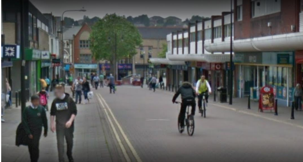
Llun 2: Ardal B - Ardal i gerddwyr Holton Road (gweler hefyd Atodiad B)