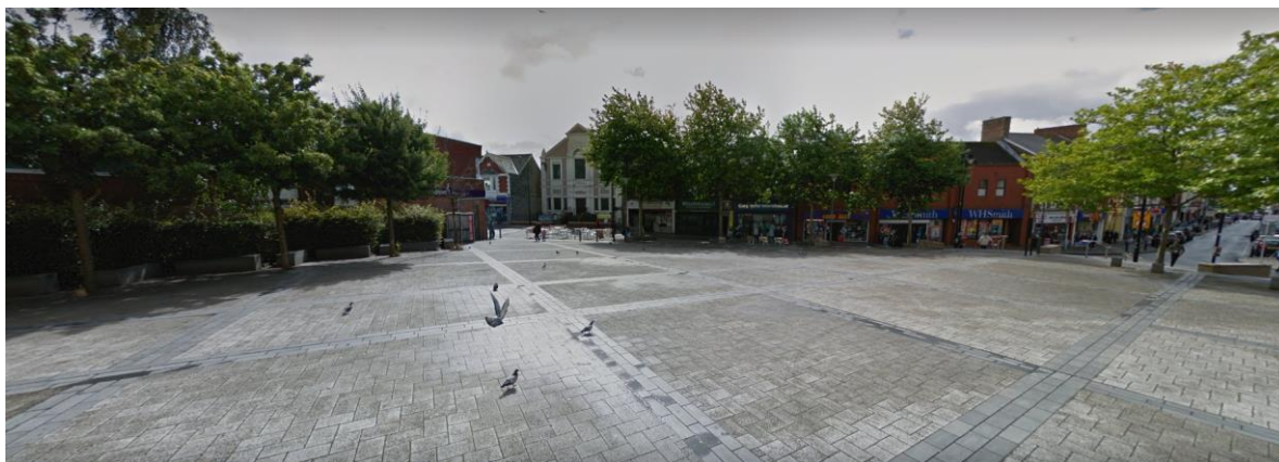
Llun 1: Ardal A wedi'i Neilltuo - Sgwâr y Brenin (gweler atodiad A hefyd)