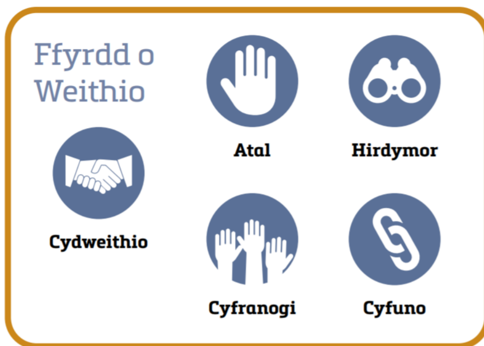
Ffigur 2: Y Pum Ffordd o Weithio